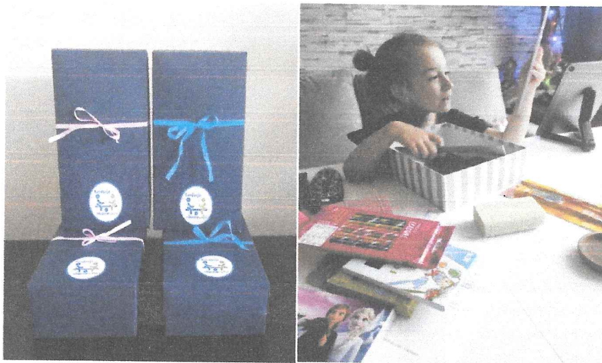
uWAŻNIki i Julka oglądająca zawartość jednego z nich.

Każdy ze zgłoszonych do programu Fundacji podopiecznych otrzymał uWAŻNIk – pudełko, zawierające instrukcje w formie listu oraz wyposażone w materiały plastyczne, które następnie zapełnił przedmiotami lub rysunkami, opisującymi jego samego i jego zainteresowania. Następnie podczas indywidualnego spotkania z wolontariuszami zawartość uWAŻNIka została szczegółowo omówiona, co pozwoliło wolontariuszom poznać potrzeby i pasje każdego z dzieci. Spotkania podopiecznych z wolontariuszami mają dodatkową wartość – tworzą więź między podopiecznym a wolontariuszami i pozwalają dostosować ofertę do potrzeb konkretnego dziecka.