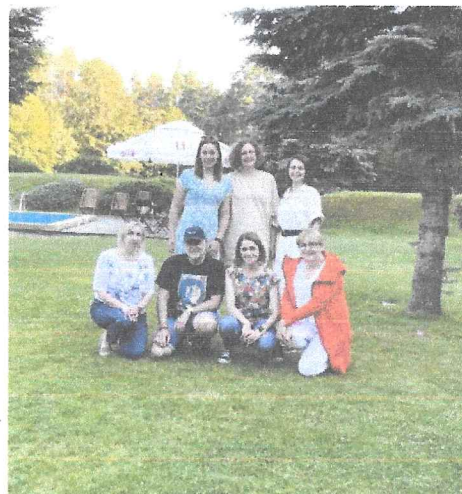
Spotkanie Zarządu i Rady Fundacji – 4-5 lipca 2022.

- 4-5 lipca 2022 roku odbyło się w Przyłęsku koło Gorzowa Wielkopolskiego wspólne spotkanie Zarządu oraz Rady Fundacji, w czasie którego podjęto uchwałę w sprawie wysokości zwrotu kosztów dojazdu oraz innych kosztów poniesionych przez wolontariuszy oraz omówiono pierwsze przeprowadzone działania oraz pomysły na kolejne miesiące;