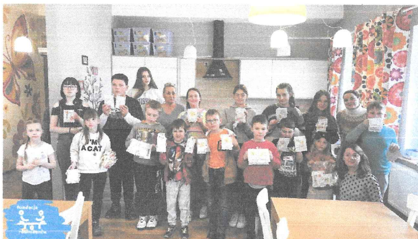
Podopieczni Świątlicy Jaskółka (rodzeństwo chorujących dzieci oraz dzieci po stracie), działającej przy gorzowskim hospicjum, w czasie warsztatów organizowanych przez FRW.

W pierwszym roku działalności Fundacji Równie Ważni objeśliśmy stałą opieką 24 dzieci z województw dolnośląskiego, lubuskiego oraz zachodniopomorskiego oraz opieką doraźną kolejne 45 dzieci z tych regionów.