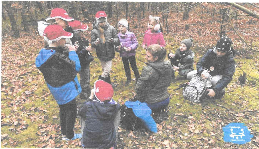
Warsztaty w Zdroisku koło Gorzowa Wlkp. (PINE – edukacja w naturze) – z okazji Dnia Niepodległości.

Ponadto nasi stali podopieczni skorzystali z następującej oferty zajęć indywidualnych: