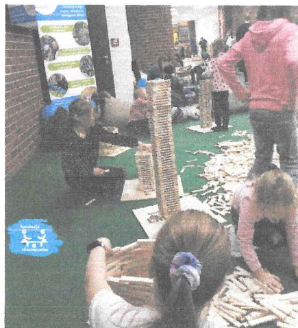
Warsztaty we Wrocławiu – Linden Park