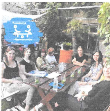
Spotkanie wolontariuszy z Wrocławia.

Cała działalność Fundacji Równie Ważni (włącznie z pełnieniem funkcji w Zarządzie i Radzie Fundacji) opiera się na dobrowolnej i nieodpłatnej pracy wolontariuszy. Jednym z celów Fundacji jest promocja i propagowanie idei wolontariatu. Taka forma zaangażowania z jednej strony przyczynia się do budowania etosu społeczeństwa obywatelskiego, a z drugiej pozwala organizacjom takim, jak nasza,