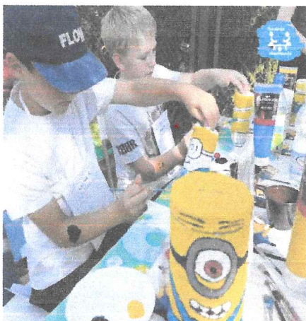
Gorzowski festyn przy hospicjum

W 2022 roku zorganizowaliśmy następujące zajęcia grupowe dla dzieci: